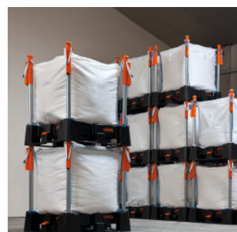
stoccaggio impilato efficiente (max 4 altezza x 1.500 kg)