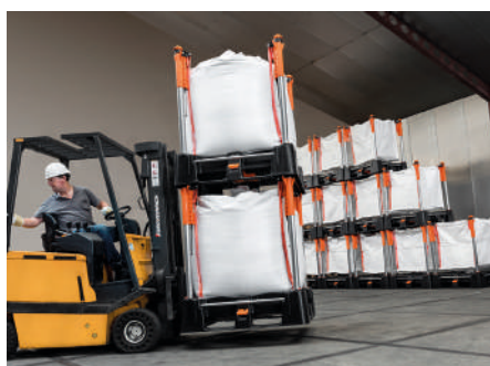
Movimentazione in sicurezza, sia in interni che in esterni