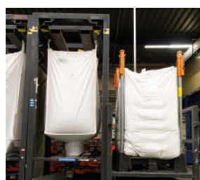
Scarico e movimentazione