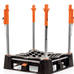
Il sistema Indus Neva completo