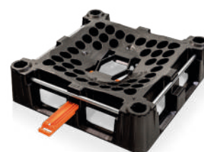
La parte inferiore di Indus Neva con valvola di scarico aperta