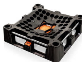
La parte inferiore di Indus Neva con valvola di scarico chiusa