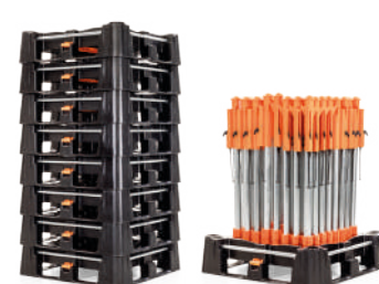
Volume contenuto con sistema non in uso